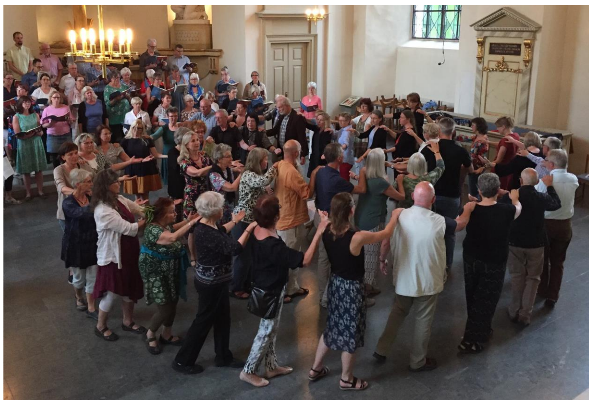
Bild från firande av dansmässan Din ljusa skugga i Karlstads domkyrka annandag pingst.

Fira gudstjänst genom att dansa tillsammans är ett sätt att öka delaktigheten i andakts- och gudstjänstlivet. Denna workshop är en fortsättning på satsningen Dansa tro – dansa liv i Karlstads och Lunds stift. En satsning som undersökt hur kulturella och musikaliska uttryck stärker människors möjlighet att dela liv och tro: Vad händer när musik, sjungna ord och kroppars rörelser möter varandra? Vad händer när den öppna cirkeln välkomnar alla? Vad händer när den folkliga traditionen möter tankar om kropp och gestaltning? Vad händer om vi minns att huvudet är en del av kroppen?